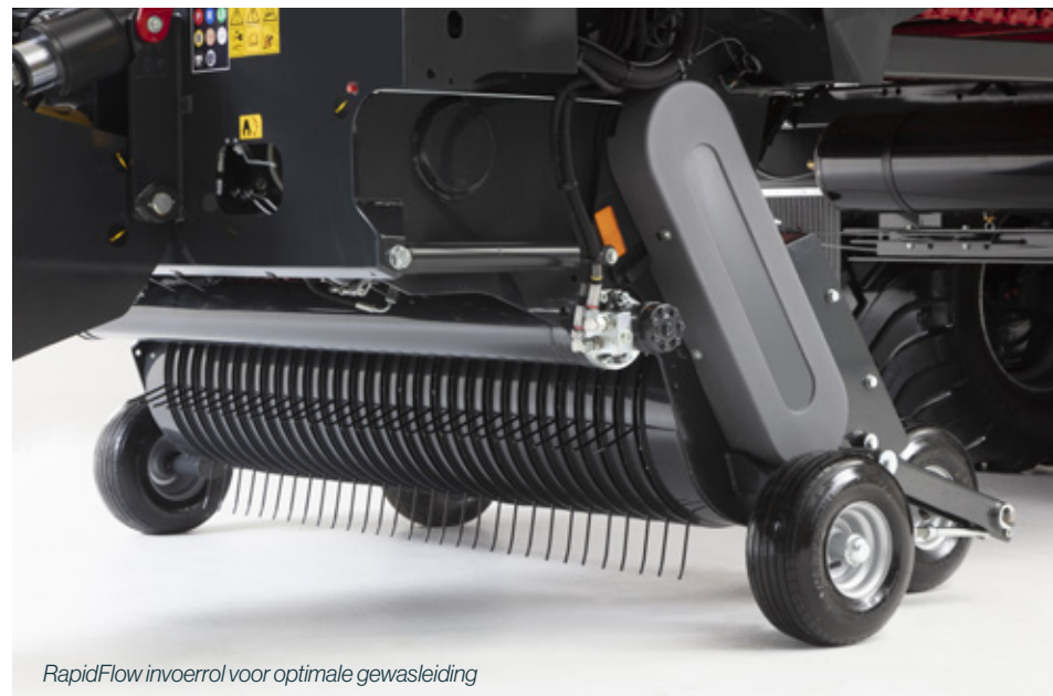
RapidFlow invoerrol voor optimale gewasleiding

Zo bereikt u moeiteloos het optimale resultaat.