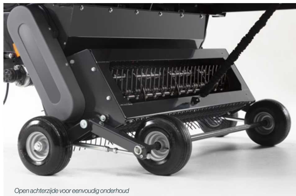
Open achterzijde voor eenvoudig onderhoud